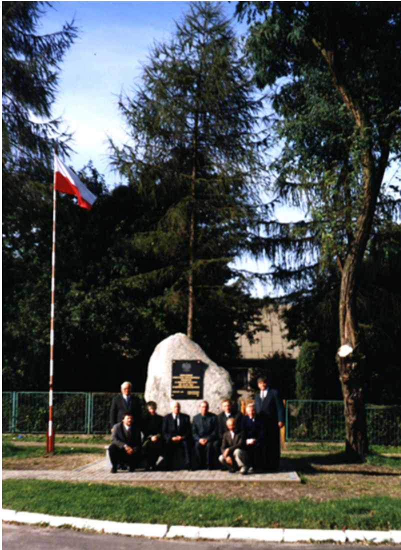
Zdjęcia pamiątkowe z odsłonięcia pomniku: