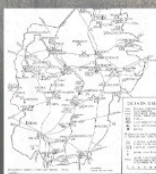
Mapa powstania styczniowego w Sieradzkim

Bitwa pod Dalikowem. Powstanie styczniowe w Sieradzkim, sieradz 1863. Zima Leczycka zbrodniem nieprzyjaciela (praca zbiorowa), 1942-1957. Męstwo i odwaga w walce. Fundacja Rozwoju Gminy PRYM 2016. Sieradz Antoni Żelazki. Zima Leczycka zbrodniem nieprzyjaciela. Anna Skokoz, Dyzalska i ogólna Warszawa 1955. https://bibliokopisowi.pl/waloryPrzyznaki/mytek/