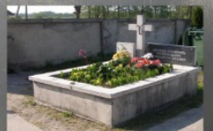
Mogiła powstańców oraz mieszkańców Dalikowa znajdujące się na cmentarzu parafialnym w Dalikowie